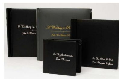
Tisk na desky